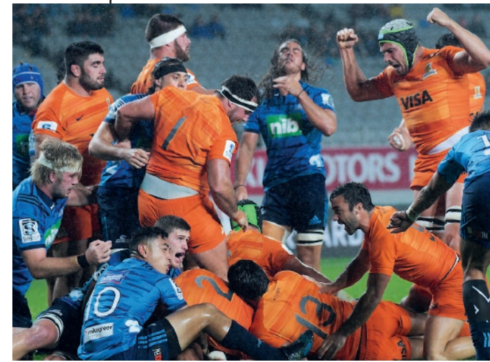
114 21/7/2018. Producto del buen nivel y una seguidilla de siete triunfos consecutivos, en su tercer año Jaguares pudo clasificar por primera vez a los cuartos de final del Super Rugby. Fue frente a los Lions –a quienes habían superado durante la fase inicial-, en el Ellis Park de Johannesburg. Si bien los sudafricanos se impusieron por 40-23, la franquicia argentina cerraba de gran forma un año con mucha expectativa para lo que venía.