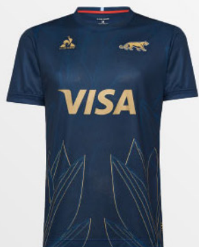
Pumas Away Fan