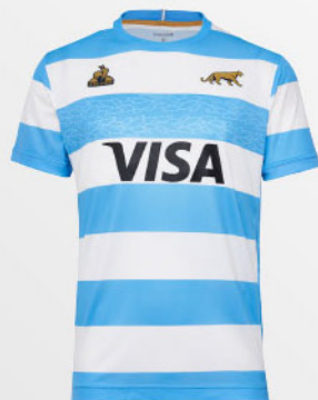
Pumas Home Fan