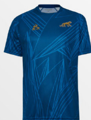
Camiseta Training Los Pumas

Indumentaria oficial y productos exclusivos, en un solo lugar.